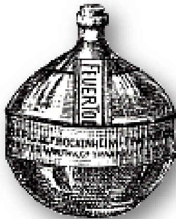
Schönberg's Granate Bockenheim Frankfurt etc